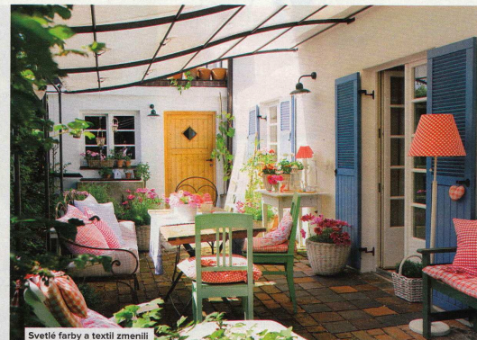
Svetlé farby a textíly zmenili prídomie na primorský raj.